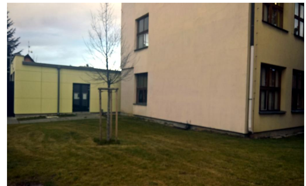
Pohled na řešené území - stávající stav