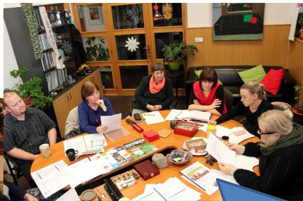
Pracovní schůzka Redakční rad PPRŠ